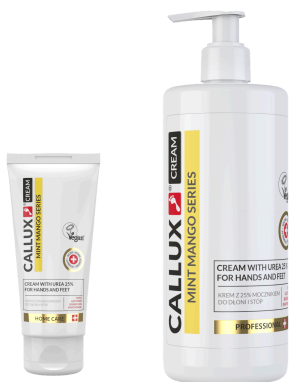
Mango krém 25% urea tartalommal (100ml, 500ml pumpás)

Összetevőinek köszönhetően, intenzíven hidratáló, puhító, regeneráló hatású krém.