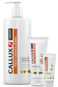
Friss narancs krém (25ml, 100ml, 500ml pumpás)

Használata: Masszírozzon megfelelő mennyiségű krémet a bőrbe és hagyja beszívódni. Naponta többször alkalmazható