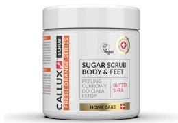
Friss narancs peeling (250g, 400g)

A Friss narancs peeling a finom cukorkristályok segítségével tisztítja a bőrt és hatékonyan távolítja el az elhalt hámsejteket. A benne lévő sheavaj bőrpuhító hatását, hidratálja a bőrt és segít megőrizni a rugalmasságát. Az édesmandula olaj segít visszanyerni a bőr lipid egyensúlyát, a bőr puhává és ragyogóvá válik. A természetes alapanyagok összetételének köszönhetően használatra ideális az érzékeny bőr számára is, hidratálja, és táplálja az egész testet, a kezeket és a lábakat. Az E-vitamin védi, hidratálja, puhává teszi a bőrt és anti-age faktorként hat. A legjobb eredmény elérése érdekében, hetente érdemes többször alkalmazni!