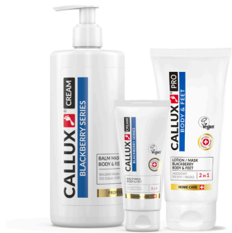
Blackberry krém/maszk (100ml, 250ml, 500ml pumpás)

A Feketeszeder krém/maszk egyaránt használható testápoló, illetve hidratáló pakolásként, mindez a feketeszeder csábító illatának mámorában. Mélyhidratáló és tápláló hatású, ezért tökéletes választás a fáradt, száraz bőrre. Egyik fő összetevője a Sheavaj , ami kiváló bőrpuhító. A-, E- és F- vitaminokban gazdag, remek ápolója a száraz, érzékeny bőrnek. Napraforgó olajat tartalmaz, amiben a bőr számára fontos omega zsírsavak találhatóak. Hatásos az irritált vagy kiszáradt bőr természetes védőrétegének helyreállításában, bőrpuhító és bőrvjavító anyagot tartalmaz, ami nem szívódik fel, hanem a bőr felszínén képez védőréteget. A feketeszeder pakolás tulajdonságai és hatásai: hidratáló, ráncatlanító, regeneráló, feszesítő, tápláló, pihentető, nyugtató. Használható minden nap, maszk, arckrém és testápolóként. Zsíros, tág pórusú arcbőrre nem ajánlott a használata. Használata: Masszírozzon megfelelő mennyiségű krémet a bőre és hagyja beszívódni. Naponta többször alkalmazható. Pakolásként: Vigyen fel a megtisztított bőrre nagyobb mennyiségű krémet, hagyja hatni 10-15 percet majd masszírozza be finoman, a felesleget törölje le egy száraz kendővel.