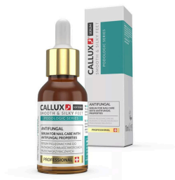
Fungicid szérum teafaolajjal (10ml)