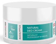
Eukaliptusz natúr krémdezodor (50ml)

Használata: Vigyen fel kis mennyiségű készítményt a bőrre és finoman masszírozza be. Naponta használja.