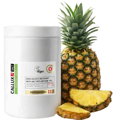
Ananászos Epsom fürdőszó (1000g)

Az Epsom-só (magnézium-szulfát) egy kiválóan vízdoldékony ásványi anyag , amelyet évszázadok óta használnak méregtelenítésre, stresszoldásra, izomlazításra és bőrápolásra. Kádfürdőhöz adva segíti az izomregenerációt, a bőr hámlasztását és a magnéziumpótlást, de székrekedés ellen is alkalmazzák.