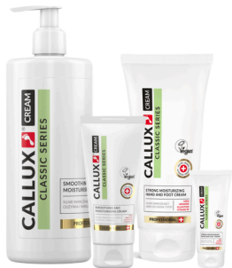
Ápoló és hidratáló krém (25ml, 100ml, 250ml, 500ml pumpás)

Ápoló és hidratáló krém ureával és fantasztikus összetevőkkel. Összetevőinek köszönhetően táplálja, hidratálja, puhítja, nyugtatja és regenerálja a bőrt.