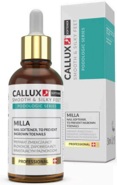
MILLA körömlágyító (50ml)

Használat: A mellékelt pipettával csepegtessük be a körömszéleket, körömlemezt és a nyomási pontokat, finoman masszírozzuk be, majd hagyjuk hatni.