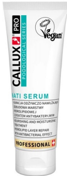
NATI szérum teafaolajjal (100ml)

A Nati szérum olyan 100%-ban természetes növényi olajokat tartalmaz melyek hosszan tartó tápláló, hidratáló és puhító tulajdonságokkal rendelkeznek.