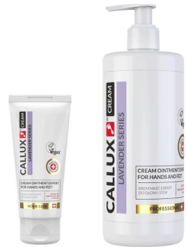
Levendula krém (100ml, 500ml pumpás)