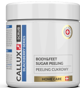
Blackberry peeling (250g, 400g)

A Feketeszeder peeling, a szeder magjával és a finom cukorkristályok segítségével tisztítja a bőrt és hatékonyan távolítja el az elhalt hámsejteket. A benne lévő sheavaj bőrpuhító hatású, hidratálja a bőrt és segít megőrizni a rugalmasságát. Az édesmandula olaj segít visszanyerni a bőr lipid egyensúlyát, a bőr puhává és ragyogóvá válik. A természetes alapanyagok összetételének köszönhetően használata ideális az érzékeny bőr számára is, hidratálja, és táplálja az egész testet, a kezeket és a lábakat. Az E-vitamin védi, hidratálja, puhává teszi a bőrt és anti-age faktorként hat. A legjobb eredmény elérése érdekében, hetente érdemes többször alkalmazni.