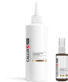
Antibakteriális spray (55ml), utántöltő (500ml)

Naponta többször, szükségyszerűen használható izzadásgátlásra és/vagy fertőtlenítésre egyaránt.