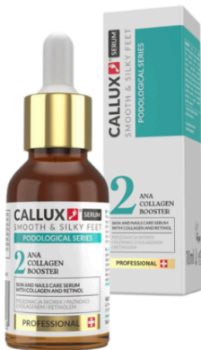
ANA COLLAGEN BOOSTER 10 ml

Használati utasítás: Vigye fel a bőrre, hagyja felszívódni. Használja naponta 1-2 alkalommal. Ne használja a szérumot más retinoid tartalmú termékekkel kombinálva.