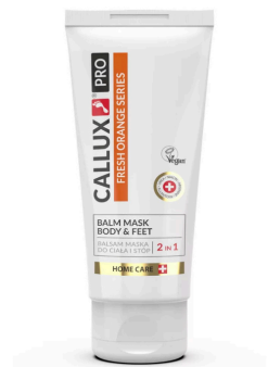
Friss narancs krém/maszk (250ml)

Használata: Masszírozzon megfelelő mennyiségű krémet a bőrbe és hagyja beszívódni. Naponta többször alkalmazható. Pakolásként: Vigyen fel a megtisztított bőrre nagyobb mennyiségű krémet, hagyja hatni 10-15 percet majd masszírozza be finoman, a felesleget törölje le egy száraz kendővel.