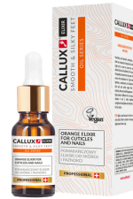
Narancs elixír (10ml)

Körömgomba, bőrgomba, gyulladt, benőtt köröm/bőr esetén is használható.