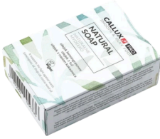
Szappan tuja olajjal (100g)

Növényi eredetű összetevőkben gazdag természetes szappan. Psoriasisos, szemölcsös, pattanásos bőr kezelésére is ajánlott. Tuja olaj tartalmának köszönhetően antibakteriális és tisztító hatású, fertőzésgátló, hámosító, elősegíti a bőr aktív regenerálódását, gyulladáscsökkentő, hozzájárul a pattanások és aknék gyógyulásához.