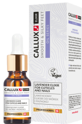
Levendula elixír (10ml)

Használata: Vigyen fel kis mennyiségű elixírt a körmökre és a kutikulára, masszírozza be és hagyja felszívódni. Naponta többszöri használata javasolt.