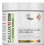
Classic só 45% urea tartalommal (250g)

Használata: Masszírozzon megfelelő mennyiségű krémet a bőrebe. Napi használata javasolt.