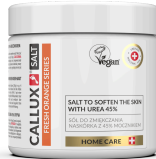
Friss narancs só 45% urea tartalommal (250g)

Fantasztikus, narancs illatú só, extra magas (45%) Urea tartalommal, ami kiválóan puhítja a bőrt és a körmöket, lágyító és hidratáló hatású, szabályozza a szaruréteg kialakulását, fertőtlenítő és fungicid hatású. A Callux sóban található közönséges só, kisebb-nagyobb szemcsékben, Urea-t 45% -ban, Kamilla illóolajat , Citrusolajat , Levendulaolajat , rózsailatú Gerániumolajat és Citromfűolajat . Egyszerrel telis tele finom olajokkal. Ettől vannak a finom illatok és az olajos érzet, mivel az olajok 100%-ban nem oldódnak a vízben.