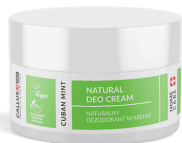
Cuban Mint natúr krémdezodor (50ml)

Izzadásgátló krémdezodor. Mentolt tartalmaz.